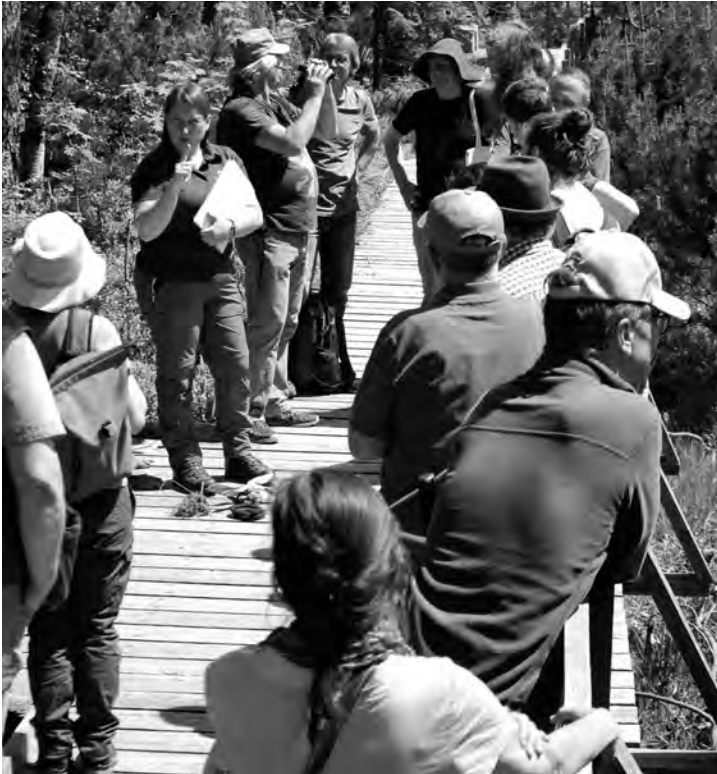
Jährliches Treffen der Unteren Naturschutzbehörde mit den ehrenamtlichen Naturschutzbeauftragten und den Naturschutzwarten des Landkreises Rastatt.

Ökosystemen erarbeiten können. Ziel ist es, auch bei künftigen Generationen ein Bewusstsein für den Erhalt und den Schutz dieses sensiblen Ökosystems zu schaffen.