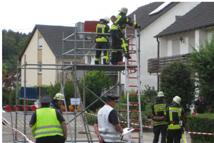
„Person über Steckleiter retten“