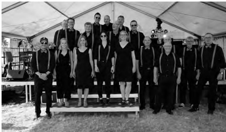
SW Big Band beim Dorffest am 18.06.2023

Bei schlechtem Wetter fällt die Veranstaltung aus.