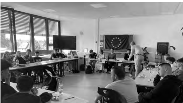
Das Planspiel macht internationale Politik erlebbar.

Im Rahmen des Planspiels gewannen die Schüler wertvolle Einblicke in die komplexen Herausforderungen der EU-Flüchtlingspolitik. Sie lernten, wie man in internationalen Verhandlungen Kompromisse findet und gemeinsame Lösungen erarbeitet. Durch die Simulation der politischen Prozesse der EU konnten sie die Funktionsweise der Union und die Rolle der Mitgliedsstaaten bei der Gestaltung gemeinsamer Politiken besser verstehen. Ein wich-