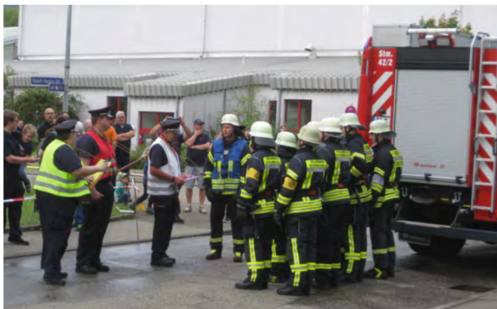
„Schiedsrichter vor der angetretenen Mannschaft“