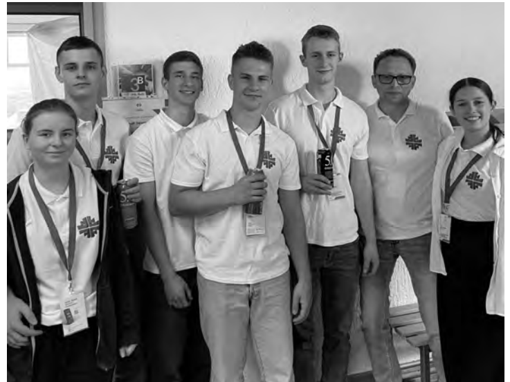
Die Teilnehmer der Turnerschaft Steinmauern beim Landesturnfest in Ravensburg

Als unsere 7 Turnfestteilnehmer am Donnerstag, 30. Mai, zum Landesturnfest nach Ravensburg zusammen mit den Teilnehmern des Rastatter TV und des TB Sinzheim per Bus aufbrachen, war noch keinem bewusst, was das Wichtigste in den folgenden 4 Tagen sein wird. Das absolute Must-have beim diesjährigen Landesturnfest in Ravensburg war nämlich Regenschirm und Regenjacke. Die 22 Vereine mit über 400 Sportlerinnen und Sportlern aus unserem Turngau die am Landesturnfest in Ravensburg teilnahmen waren an mehreren Schulen verteilt untergebracht. Unsere Teilnehmer hatten das Glück und waren einige Kilometer außerhalb von Ravensburg auf einer Anhöhe an der Grundschule Berg untergebracht. Die Schulbetreuung war gut und es gab ein gutes Getränke- und ein ausreichendes Imbissangebot. Nach unserer Ankunft um die Mittagszeit und der Einquartierung im Klassenzimmer machten sich unsere Turnerinnen und Turner auf den Weg nach Ravensburg um die Stadt zu erkunden. Am Abend nahmen sie an der Eröffnungsfeier in der Innenstadt teil. Als der